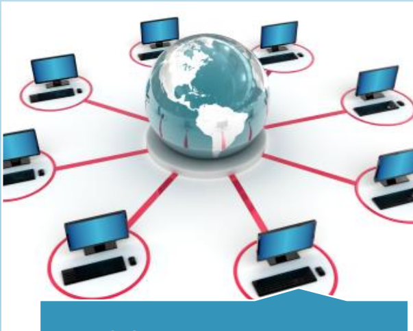
Télégestion et renvoi d'alarmes