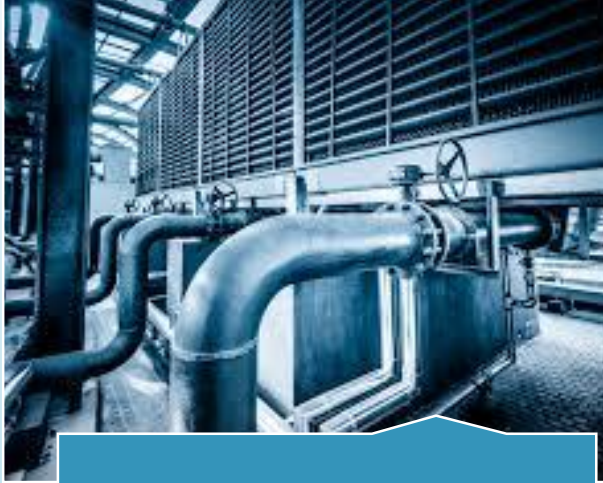
HVAC / CVC