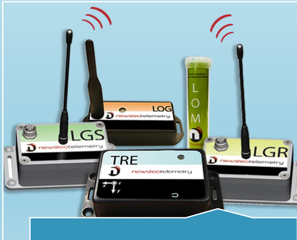
Datalogger sans fil