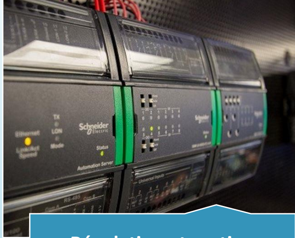
Régulation et gestion technique du bâtiment