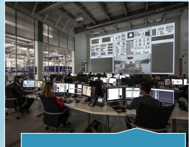
Supervision / Scada